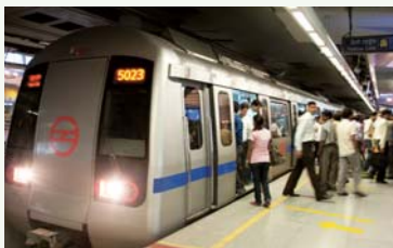
デリーメトロの様子

インド デリー-高速輸送システム建設事業 ～日本の技術が結集したデリーの最新型地下鉄～